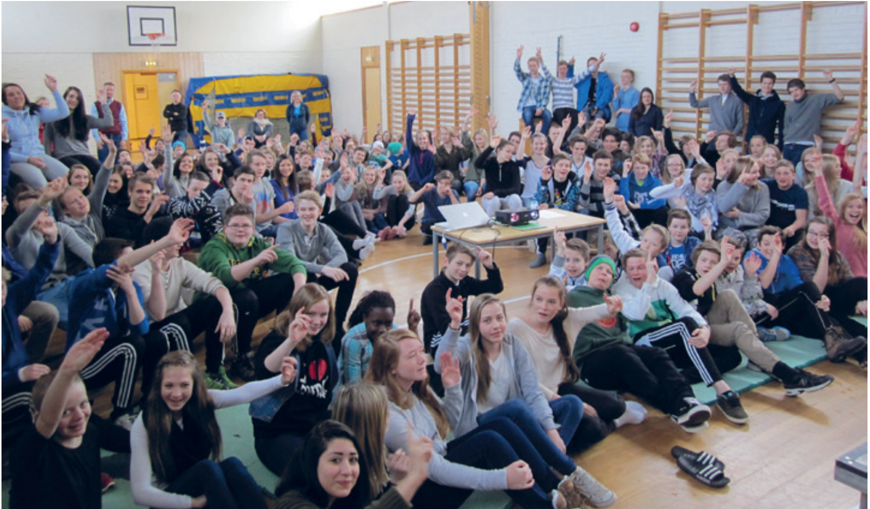
Hvem vil være med? Engasjert ungdomstrinn under presentasjon og tegnedag 18. mars 2013.