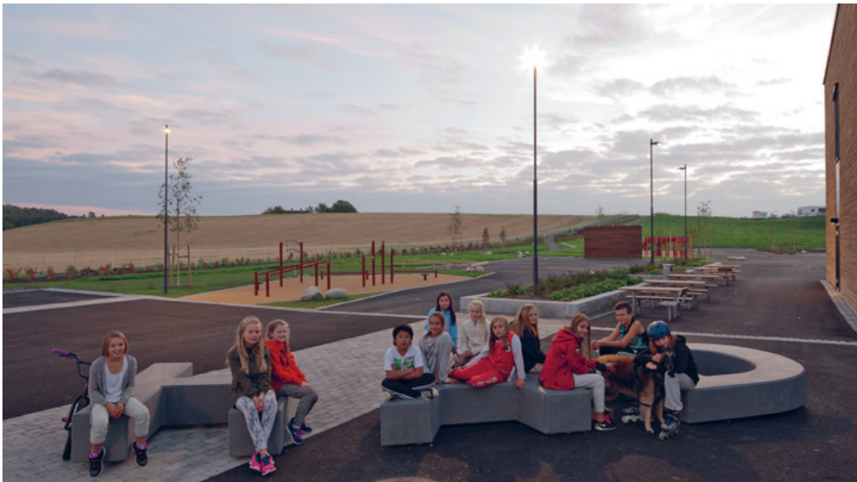
Ti bokstaver: Andre del av kunstverket er ti betongelementer som ligger spredt rundt i sør. Her tre av bokstavene sammen med barn i området, september 2014.