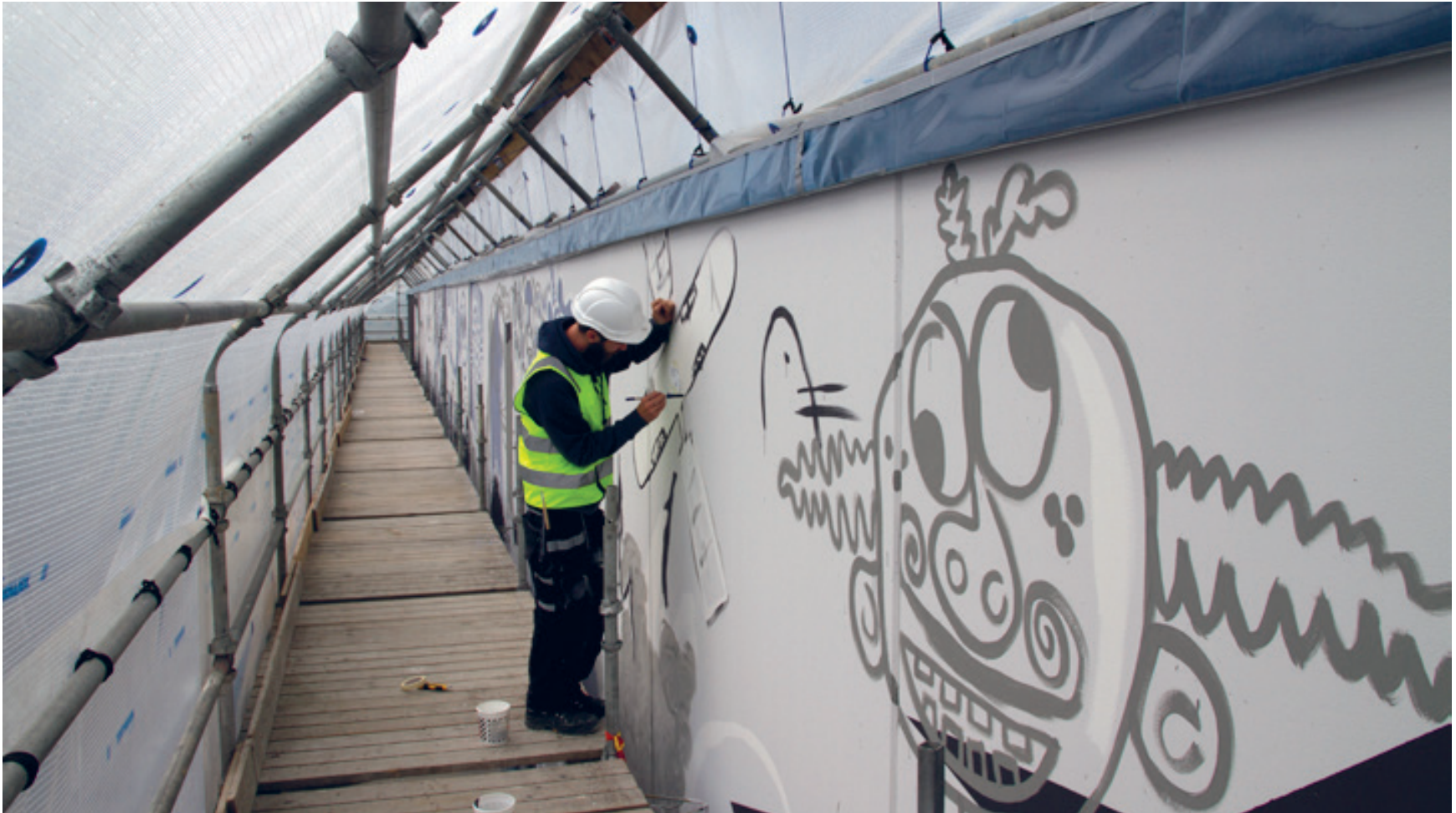
Arbeidet på fasaden ble utført under presenning i juni 2014 med motiv fra småskoletrinnet plassert i nord, mellomtrinnet i øst og ungdomstrinnet i sør.