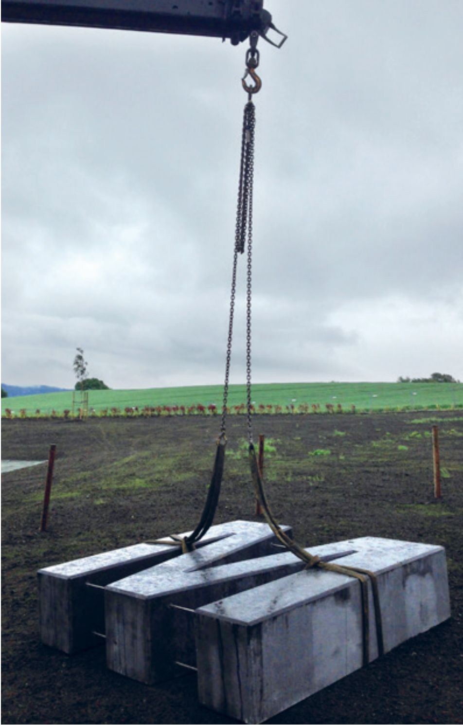
Plassering av bokstav M, juni 2014.