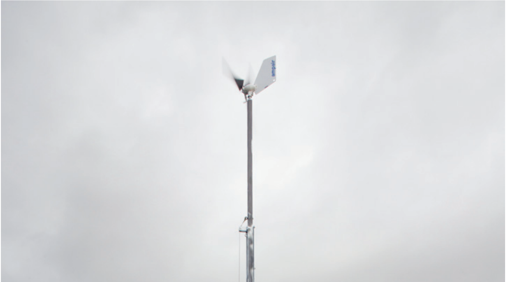
Utendørs vindmølle: Den permanente vindmøllen på skolens uteområde produserer strøm til takvifte og lystavler med foto inne i skolens aula.