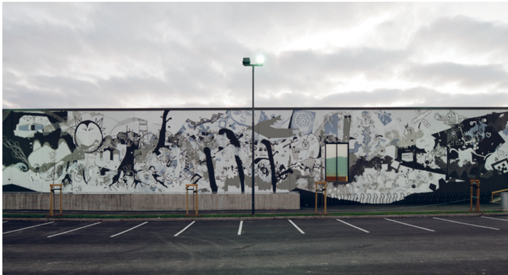
Store flater: Over 750 m 2 vegg er dekket av tegning, med den største flaten her i øst.