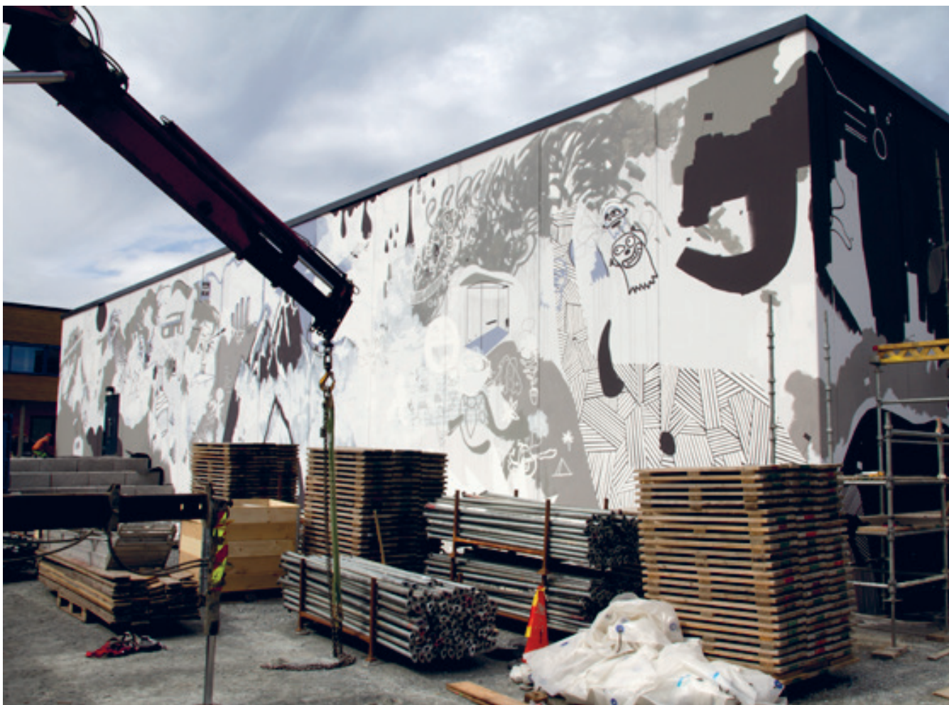
Før og etter: Fra tom vegg i februar til ferdig verk juli, 2014.